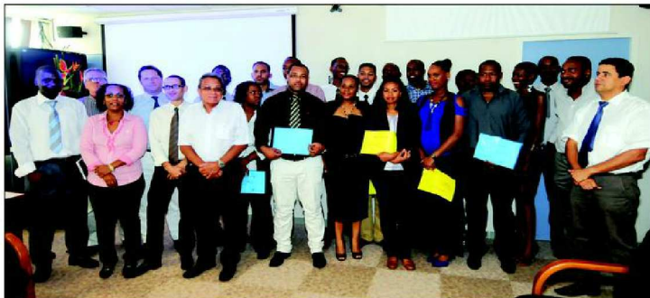
Photo de famille des nouveaux diplômés, en compagnie de tuteurs et de responsables de l'UAG.

Les étudiants ont été accueillis aux côtés d'un tuteur manager de rayon ou chef de département au sein de plusieurs entreprises de la distribution alimentaire et non alimentaire (magasins de bricolage et de sport). Sur une promotion totale de 36 étudiants pour la Martinique, la Guadeloupe et la Guyane, 26 étudiants ont obtenu leur diplôme soit un