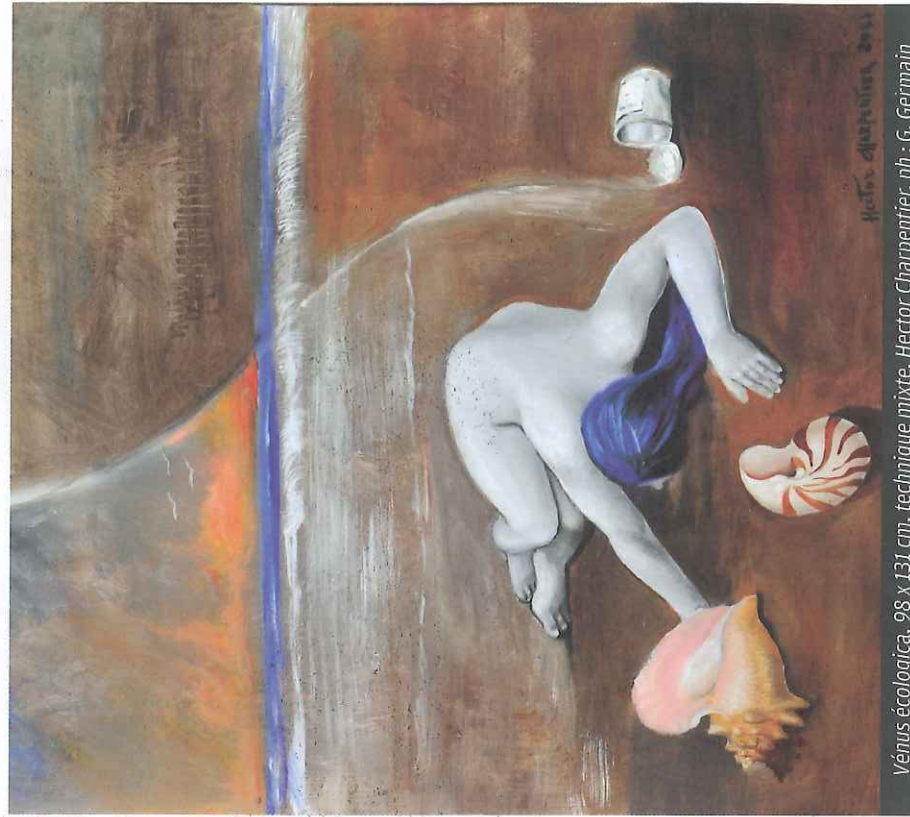
Venus écologica, 98 x 131 cm, technique mixte, Hector Charpentier, ph : G. Germain