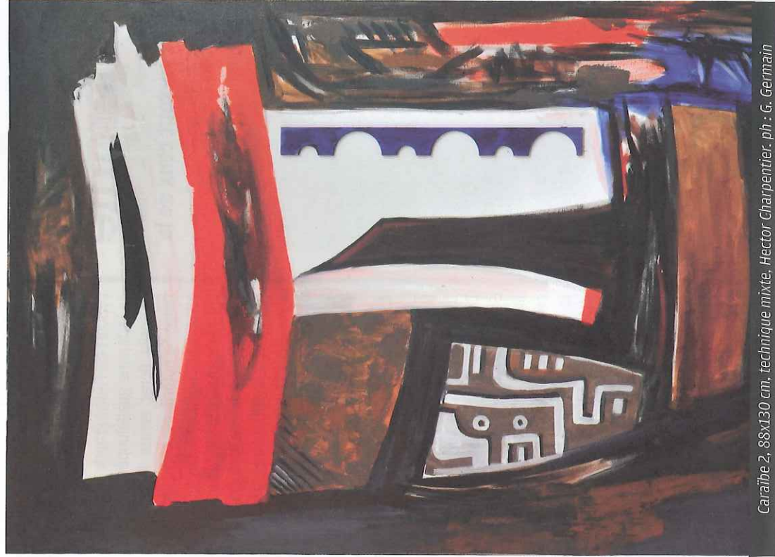
Caraiïbe 2, 88x130 cm, technique mixte, Hector Charpentier