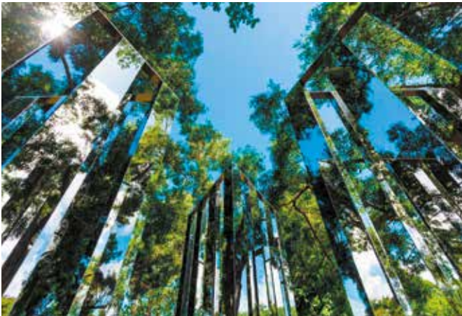
Habitation Clément, Jardin des sculptures Jeppe Hein, Dimensional Mirror , 2006