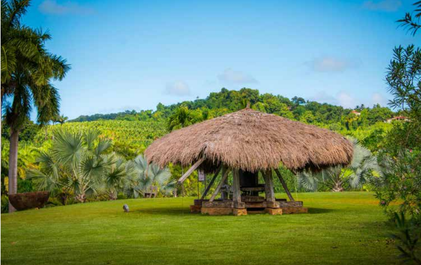
Habitation Clément , Le moulin à bêtes © Henri Salomon | Habitation Clément