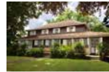
Habitation Clément Façade arrière de la maison principale