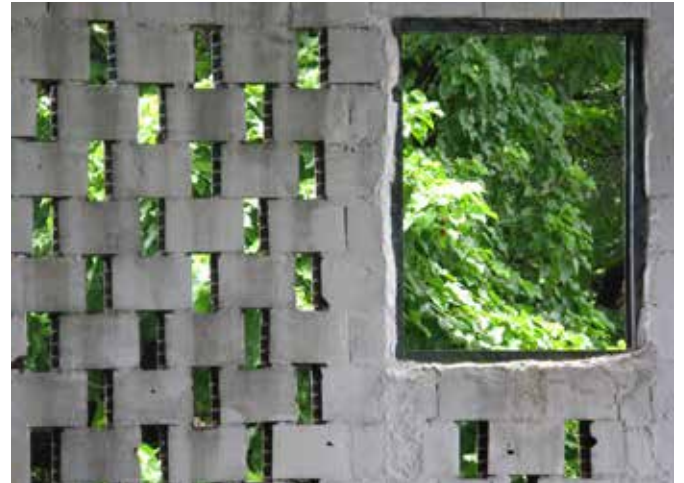
© Reichen et Robert & Associés | Fondation Clément

La Fondation s'installe ainsi avec mesure dans l'imaginaire d'un site historique exceptionnel. C'est un espace intemporel qui continue la longue et riche histoire de l'habitation rhumière.