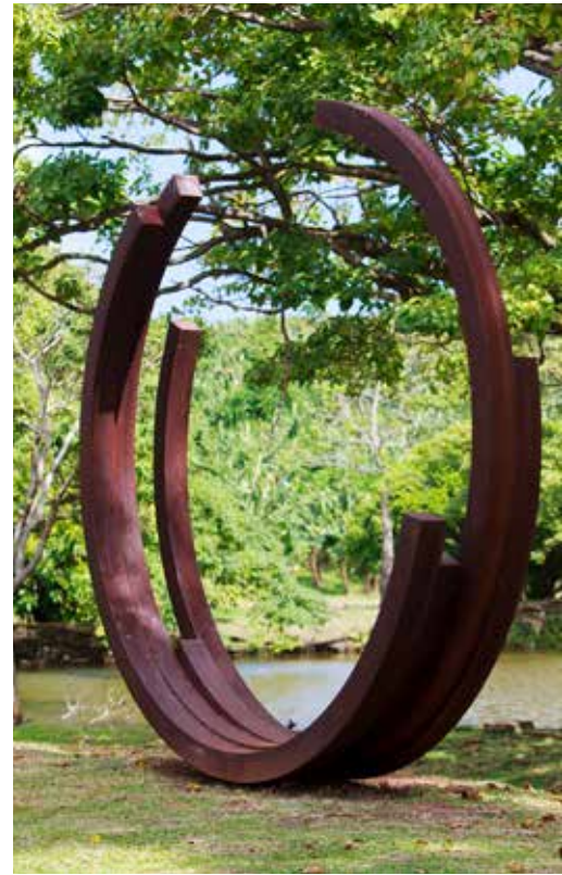
Habitation Clément, Jardin des sculptures Bernar Venet, 2000