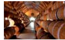
Habitation Clément Chai de vieillissement Georges-Louis Clément © Jean-François Gouait | Habitation Clément