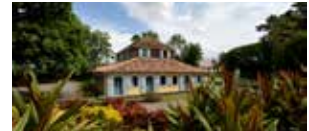
Habitation Pécoul