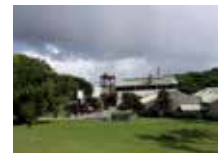
Habitation Clément L'ancienne distillerie