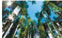
Habitation Clément – Jardin des sculptures Jeppe Hein, Dimensional Mirror , 2006 © Jean-François Gouait | Fondation Clément