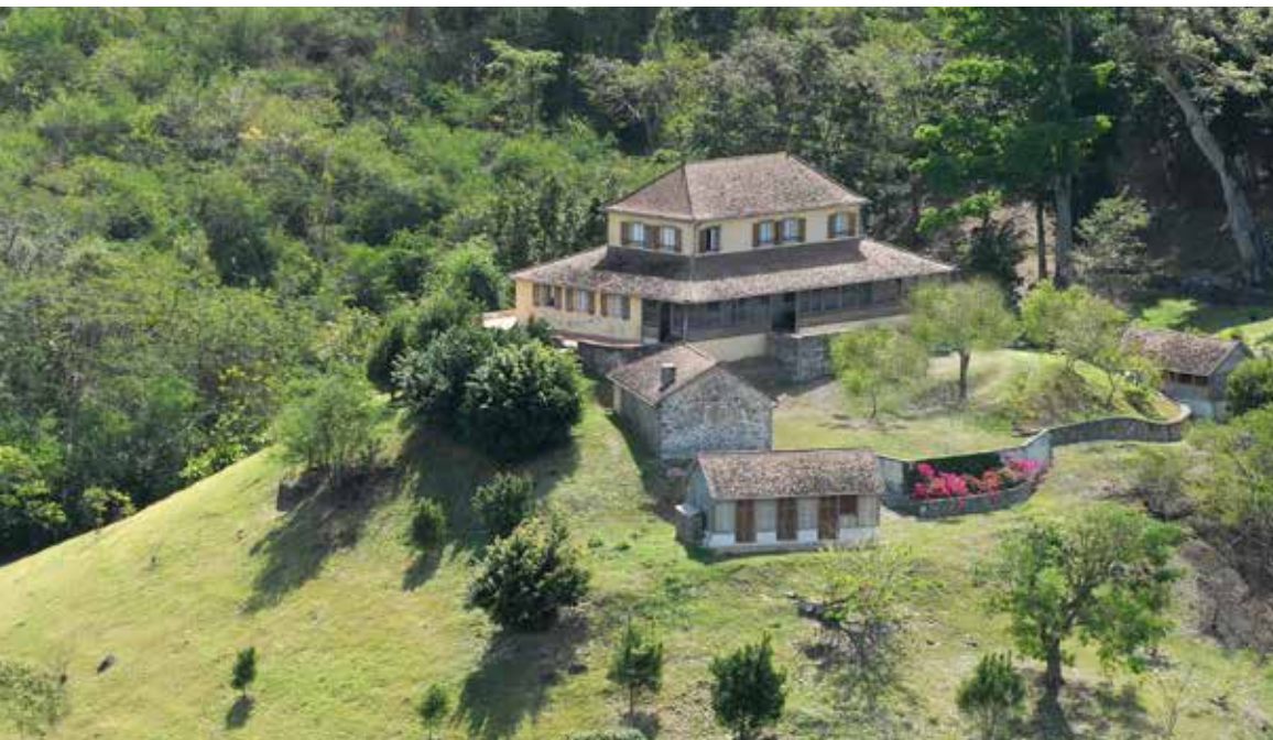
Habitation La Sucrierie , © Gérard Germain | Fondation Clément

Ces habitations, qui ont respectivement rejoint l'ensemble patrimonial géré par la Fondation Clément en 2001 et en 2002, sont ouvertes chaque année à l'occasion des Journées européennes du patrimoine. Elles reçoivent en moyenne 1700 visiteurs.