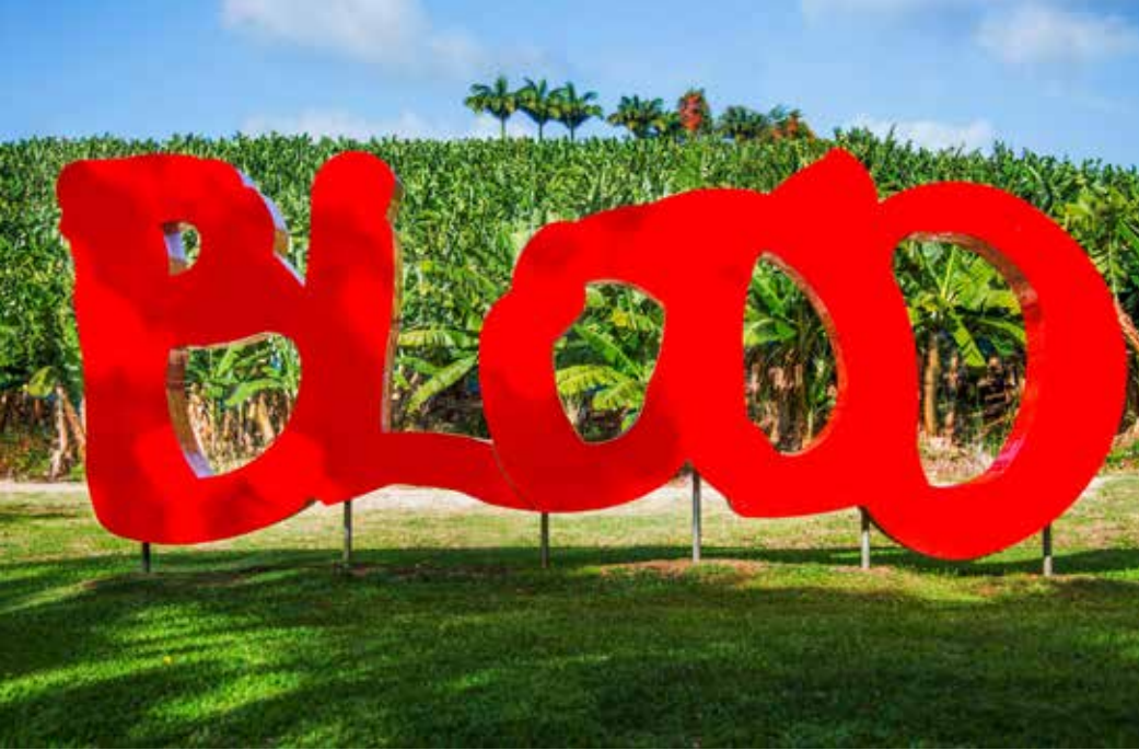
Habitation Clément, Jardin des sculptures Thierry Alet, Blood , 2011 © Henri Salomon | Fondation Clément