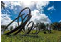
Habitation Clément – Jardin des sculptures Pablo Reinoso, Huge Sudeley Bench , 2009