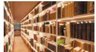
La bibliothèque