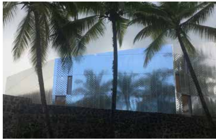
© Reichen et Robert & Associés | Fondation Clément