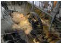
Hervé Beuze, Machinique , 2007 © Anne Chopin | Fondation Clément