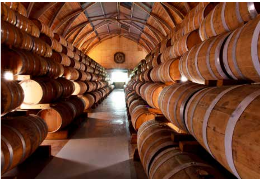
Habitation Clément , Chai de vieillissement Georges-Louis Clément © Jean-François Gouait | Habitation Clément