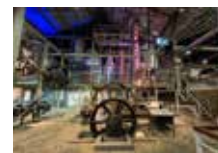
Habitation Clément Ancienne distillerie © Henri Salomon | Habitation Clément