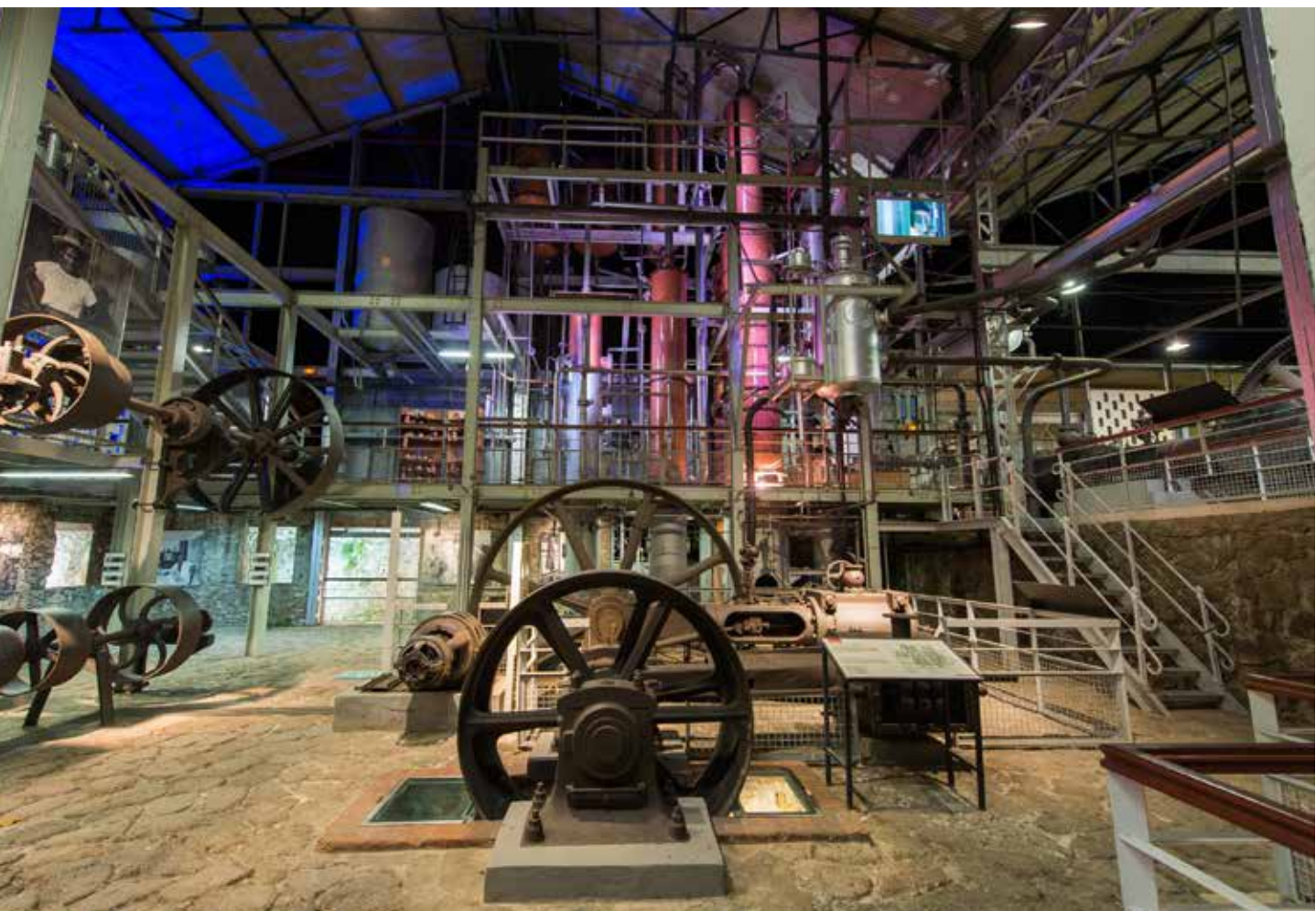
Habitation Clément , Ancienne distillerie © Henri Salomon | Habitation Clément