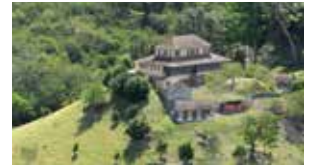
Habitation La Sucrierie