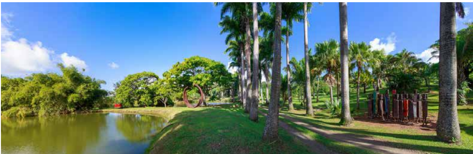
Habitation Clément, Jardin des sculptures