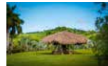
Habitation Clément Le moulin à bêtes © Henri Salomon | Habitation Clément