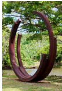
Habitation Clément – Jardin des sculptures Bernar Venet, 2000