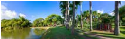
Habitation Clément Jardin des sculptures