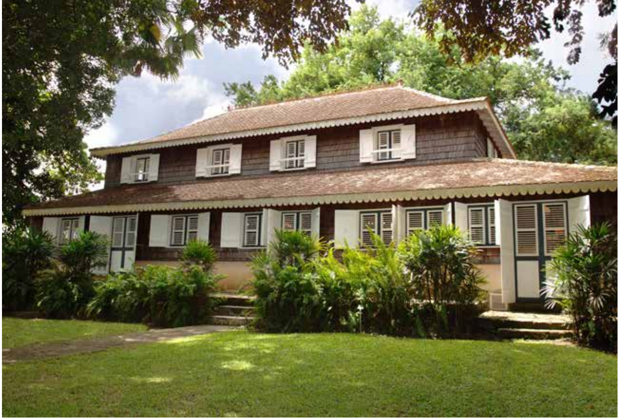
Habitation Clément , Façade arrière de la maison principale © Henri Salomon | Habitation Clément