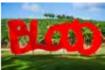
Habitation Clément – Jardin des sculptures Thierry Alet, Blood , 2011