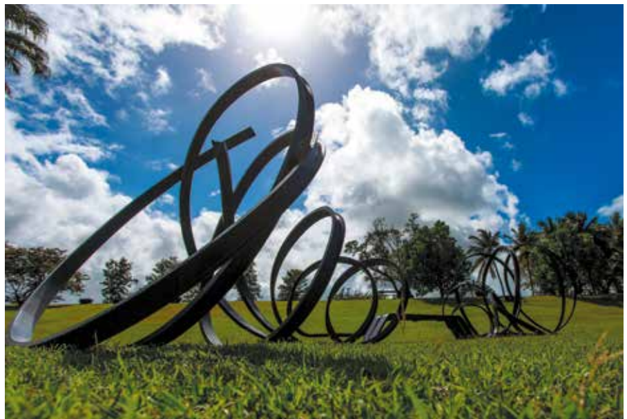
Habitation Clément, Jardin des sculptures Pablo Reinoso, Huge Sudeley Bench , 2009